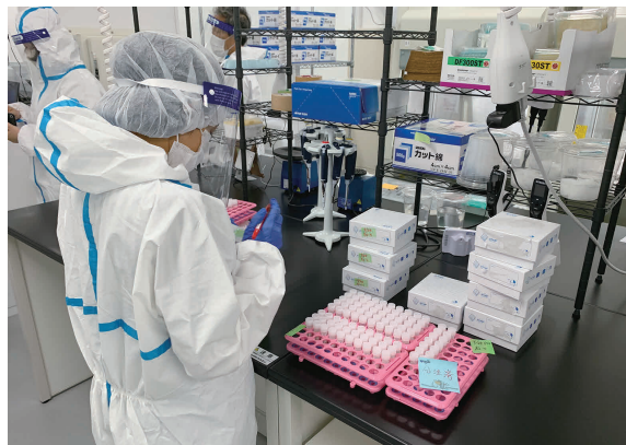
新型コロナウイルス検査センターの様子

こうした理念の下、当社はお客さま、株主、債権者、取引先、従業員などの幅広いステークホルダーを含む持続可能な社会の発展のため、さまざまな取り組みを行っています。2020年度上期においては、新型コロナウイルスの感染拡大に伴い生じる課題への支援として、抗体検査キットを感染状況の確認を必要とする医療機関等へ無償で提供しました。また唾液PCR検査を低価格・高頻度で提供することを目指す新会社「新型コロナウイルス検査センター株式会社」を設立し、同社を通じて、新型コロナウイルスの感染拡大防止および経