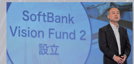
2019年 ソフトバンク・ビジョン・ファンド2始動