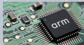
2016年 英国の半導体IP企業アームを買収