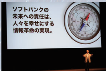
2010年「新30年ビジョン」を発表