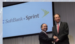
2013年 米国の通信会社スプリントを買収