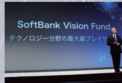
2017年 ソフトバンク・ビジョン・ファンド1始動